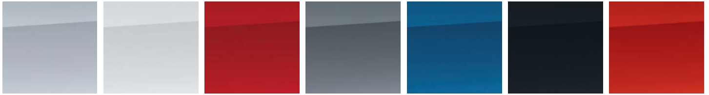
Plata Blanco Rojo Gris Azul Marino Hatchback solamente Negro Naranja