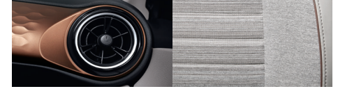
Gris / Café