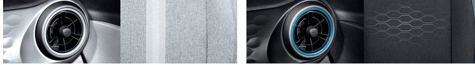
Gris Negro / Aqua